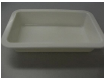
①平皿(角型 縦17cm 横10cm 深さ3.5 cm)